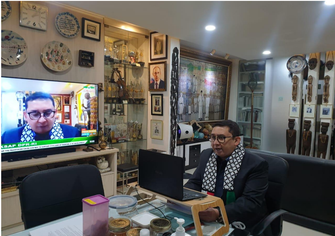
Dr. Fadli Zon, Ketua BKSAP

Prioritas Palestina untuk dikejar adalah untuk mendapatkan dukungan politik yang semakin banyak. Sikap seperti itu tidak boleh surut apapun yang akan terjadi. Harapan untuk Negara Palestina yang merdeka, demokratis, berdaulat, dan layak harus dipertahankan.